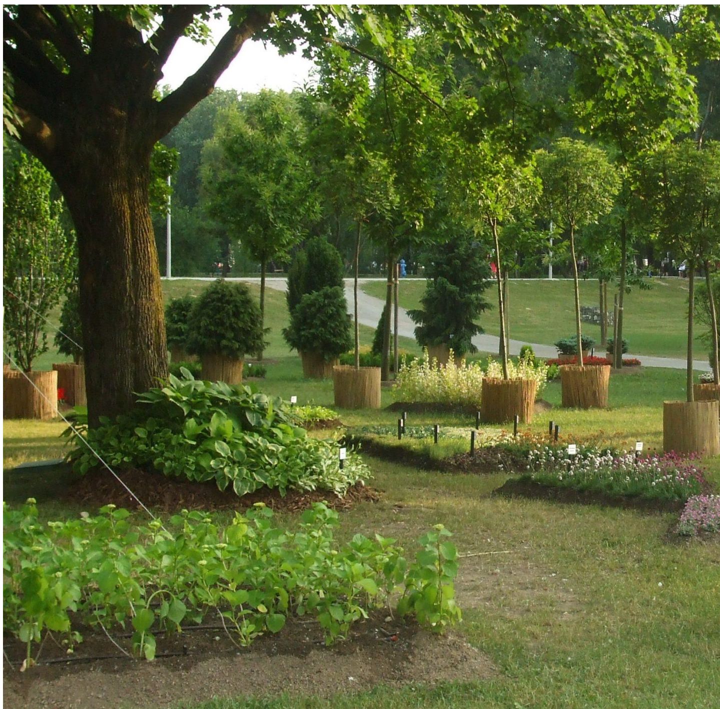
Slika: Vrtna izložba FLORAART 2009: predstavljanje ukrasnog drveća, grmlja, trajnica, ljetnica i lončanica iz vlastite proizvodnje Zagrebački holding d.o.o. - Podružnica Zrinjevac